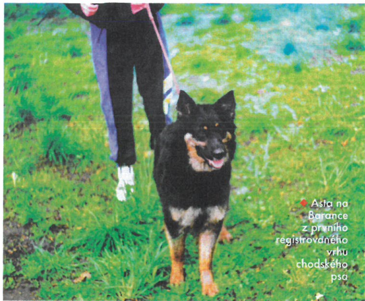
♦ Asta na Barance z prvního registrovaného vrhu chodského psa