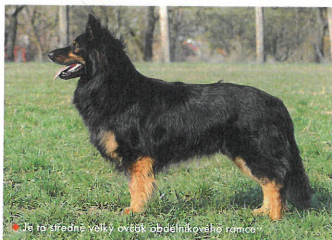
• Je to středně velký ovčák obdélníkového rámce

P rávě jemu se totiž podařilo obdivuhodně strefit do ducha doby, která přeje psům spíše přírodního vzhledu, ani moc velkým, ani moc malým, sportovně zaměřeným, nenáročným a univerzálním. Tím vším chodský pes je, oproti módním border koliím a australským ovčákům s ním však bývá snazší pořízení. Je podobně inteligentní, ale málokdy projevuje sklony k hyperaktivitě, k obsesivnímu chování či příznaky přecitlivělosti na různé podněty (hluk, světlo aj.), jaké se občas vyskytují u dvou