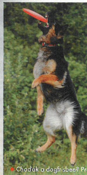
◆ Chodák a dogfrisbee? Pro

sebevědomý a razantní, i proto bývá při obranách méně úspěšný než německý ovčák. Zato má výborné vlohy pro stopy a ani poslušnost u něj nebývá problém. Oproti německému ovčákovi si s ním snáze poradí i méně zkušený