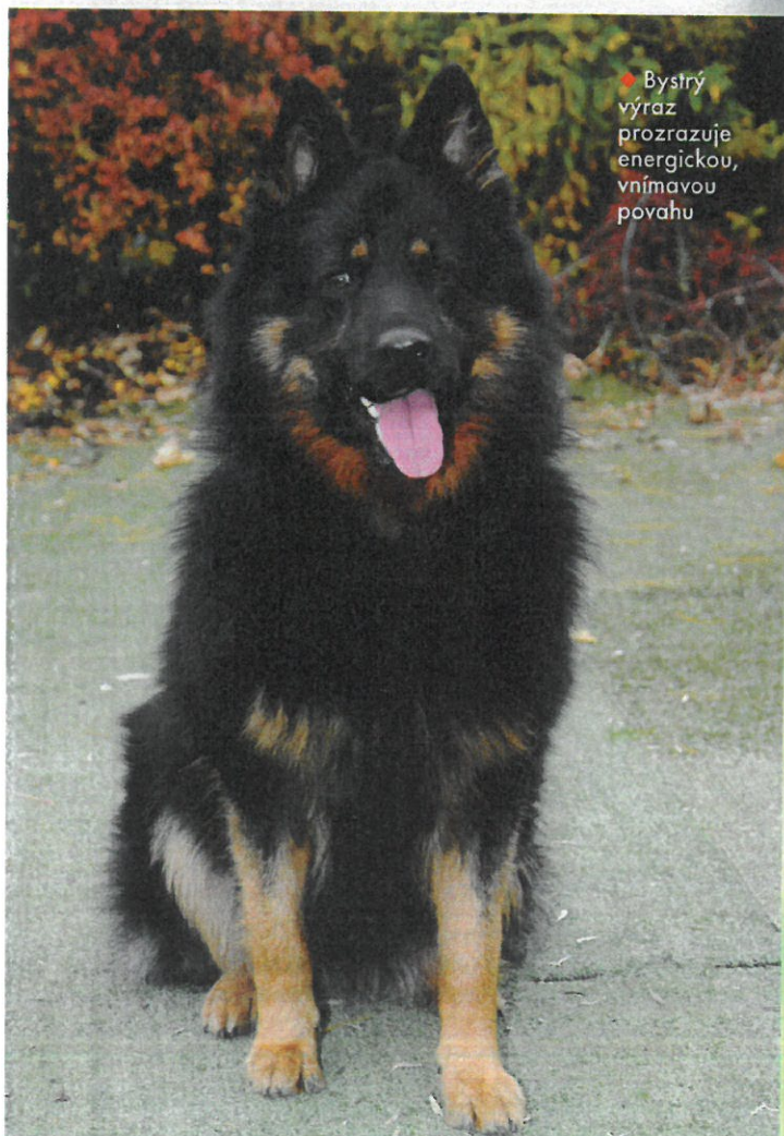
♦ Bystrý výraz prozrazuje energickou, vnímavou povahu

Naše fenky plní sto procentně jak roli rodinných psů, tak i psů sportovních. Často se o chodském psu říká, že je