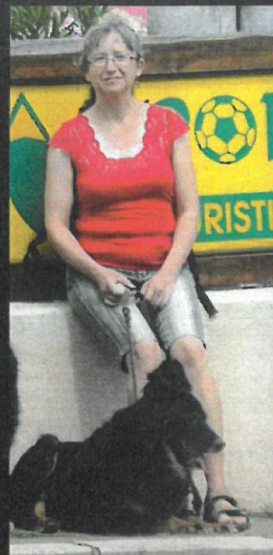
webových stránek www.kpchp.org

chodáčeků jsou prima parta. Náš klub má v současné době více než 600 členů, od počátku chovu přišlo na svět již více než 7000 jedinců, ročně je zapisováno kolem 450 štěňat. Mám velkou radost, že se naše národní plemeno chodský pes těší tak velké oblibě mezi majiteli u nás i v zahraničí. Každý rok pořádáme dvě klubové a jednu speciální výstavu, kterých se běžně účastní přes sto vystavovaných jedinců, svody a bonitace, výcvikové víkendy a soutěž o Kozinův pohár. Dlouholetou tradicí je týdenní akce KPCHP – společná dovolená majitelů a přátel chodáčeků. Veškeré informace o plemeni a akcích klubu jsou prezentovány na našich