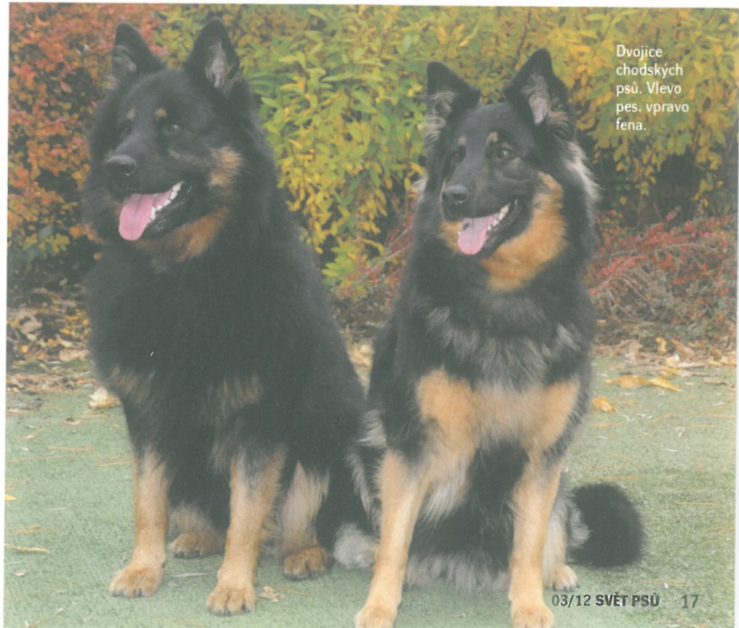
Dvojice chodských psů. Vlevo pes, vpravo fena.

Delší lesklou a hustou srst v atraktivním černo - tříslovém zbarvení, jež svého nositele výborně chrání před nepřízní počasí a pomáhá mu snášet chlad, už můžeme považovat jen za příjemný bonus,