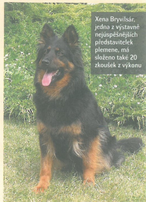
Xena Bryvílsár, jedna z výstavně nejúspěšnějších představitelk plemene, má složeno také 20 zkoušek z výkonu