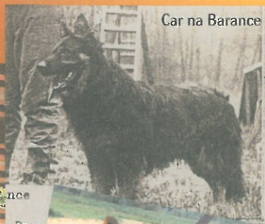
Car na Barance