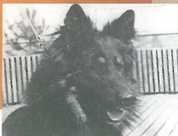
Dixi – zakladatel I. linie