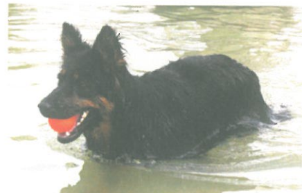
...i v létě ve vodě

skautské lilie. Není pochyb o tom, že nějací původní ovčáčtí psi se na