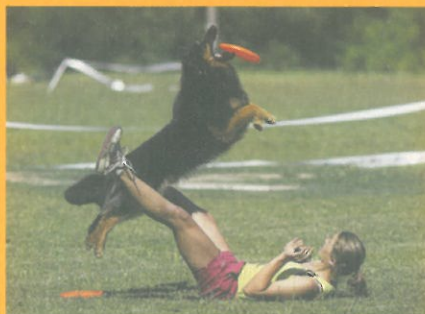
Nadšení při frisbee

Domažlicku v minulosti vyskytovali. Ovšem usuzovat z různých zmínek v uměleckých dílech na to, jak přesně vypadali, dost dobře nejde. A žádné přesnější vyobrazení z oněch „předkynologických“ dob se nedochovalo. Známy a mnohokrát citovaný pomník Jana Sladkého Koziny s věrným hraničářským psem po boku, který dodnes stojí