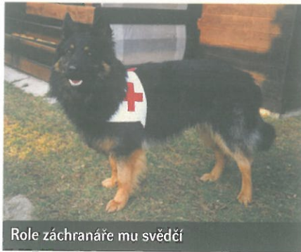
Role záchranáře mu svědčí

Díky tomu i vzhledem k přátelské, nekonfliktní a neagresivní povaze se lépe zvládá a troufnout si na něj mohou i začátečníci či větší děti, na které by byl tradiční německý ovčák příliš velký či tvrdý. Když si to tak v duchu proberete, podobných všestranných plemen menší velikosti, odolných, otužilých, dobře manipulovatelných, cenově dostupných, vhodných i pro začínající kynology, přitom schopných plnit roli ochránce a hlídače, ale i aktivního výkonného sportovce, moc není. Chodský pes je temperamentní, ale ne hyperaktivní, reakce má dostatečně rychlé, ne však zbrklé, může žít celoročně venku, sportování a soustavný trénink nadšeně vítá, ale bezpodmínečně nevyžaduje. Jeho výcvik bývá poměrně snadný, je učenlivý, ochotný