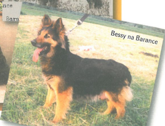
Bessy na Barance