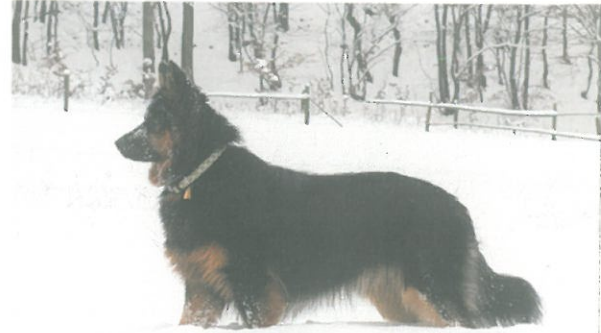
Cítí se dobře v zimě ve sněhu...

O chodských psech se literatura, odborná kynologická, ale i ta krásná, zmiňuje mnohokrát. Píše o nich ve svém díle Psohlavci i Alois Jirásek, chodské psy vcelku věrohodně popisuje i spisovatel Jindřich Šimon Baar a píše se, že žili ve vesnici Klenčí na Chodsku. Snad každý z nás zná vyobrazení psů chodských hraničářů v podání Mikoláše Alše, jejich hlava se ostatně později ocitla i ve znaku