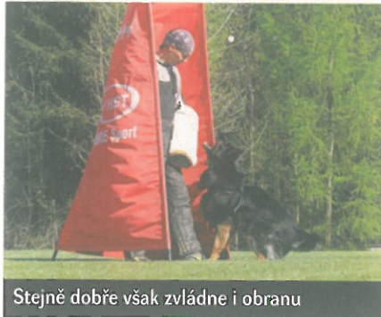
Stejně dobře však zvládne i obranu

díky němuž je pes atraktivnější, aniž by kvůli tomu na svého majitele kladl nadměrné nároky jako některá jiná dlouhosrstá plemena. Stejně jako ve všech ostatních ohledech, i co se týče péče o srst je chodský pes skromný. Postačí ji většinou jednou týdně důkladně vykartáčovat a jinak si jí - samozřejmě s výjimkou období línání, kdy je vhodné srst vyčesávat denně - téměř nevšímát. Hustá podsada chodského psa předurčuje k celoročnímu pobytu venku. Může žít i v bytě, ale v tom případě je vhodné psa v zimě nechat alespoň přespávat v chladnější místnosti a byt nepřetápět, jinak kvalita srsti zákonitě utrpí.