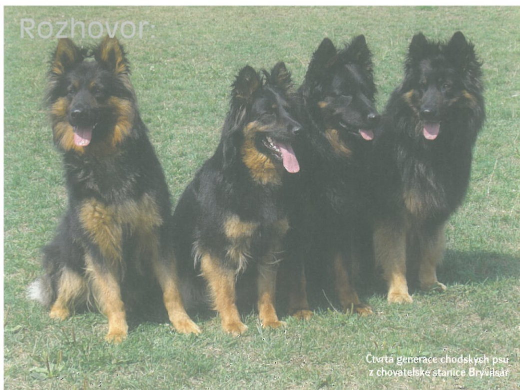
Čtvrtá generace chodských psů z chovatelské stanice Bryvílsár