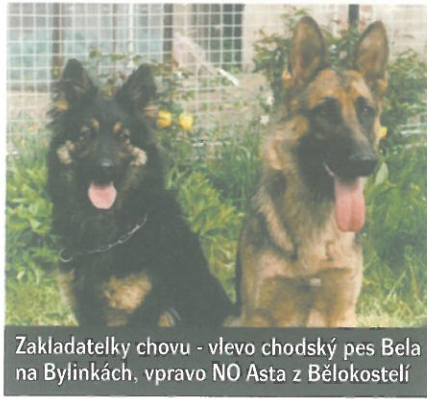
Zakladatelky chovu - vlevo chodský pes Bela na Bylinkách, vpravo NO Asta z Bělokostelí

Oficiální registrovaný chov chodského psa začal roku 1985 zápisem prvního vrhu v chovatelské stanici Na Barance Leopolda Hykela z Prostějova. V prvních pěti letech chovu bylo odchováno 90 štěňat chodského psa z 16 vrhů. Zdůrazňuji, že v těchto vrzích se narodila všechna štěňata v typu požadovaném pro toto plemeno. Žádné atypické znaky, krátká srst, nestandardní zbarvení - nic takového. Právě i toto dokladuje skutečnost, že chov chodského psa byl započat na jedincích ustáleného typu, jedincích bez PP, kteří odpovídali představám pro tvorbu a regeneraci nového národního plemene dle představ jeho zakladatele ing. Jana Findejse. Prosazoval, že z hlediska