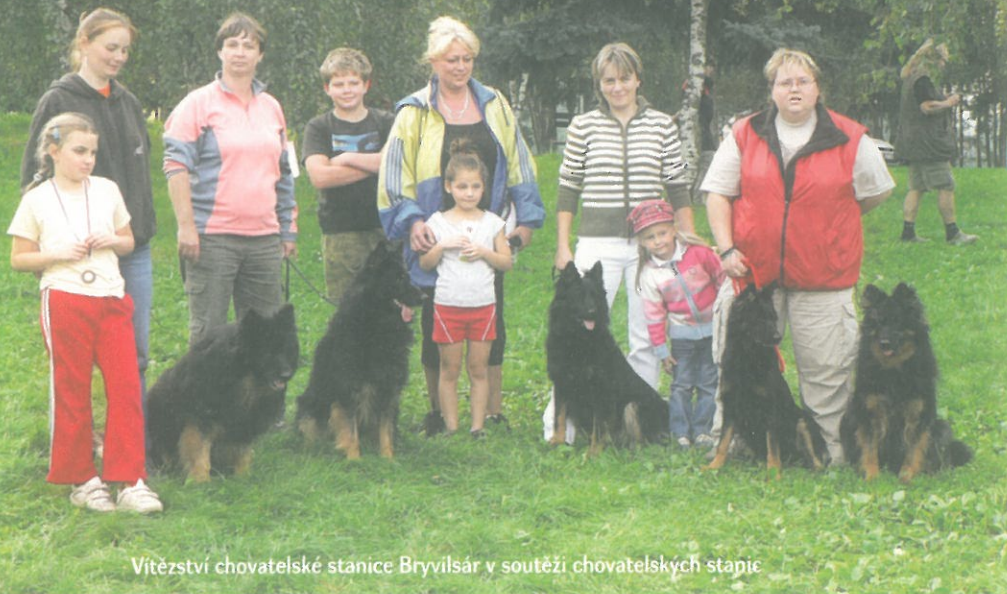
Vítězství chovatelské stanice Bryvilsár v soutěži chovatelských stanic

Manžel složil s Belou ZM, ZV1, IPO1 (na zkoušce IPO2 neuspěli v obranách, doposud si však pamatují, že stopu měli za 98 hodů), já jsem měla v té době ještě ve výcviku německé ovčáky. Mrzí mě, že osobně se v posledních letech nevěnuji výcviku tak, jak bych si přála. Účast na výstavách, práce v klubu, ČMKU, rodina, péče o vlastní psy a vše okolo mi již neumožňují věnovat se ostatním zájmům a činnostem.